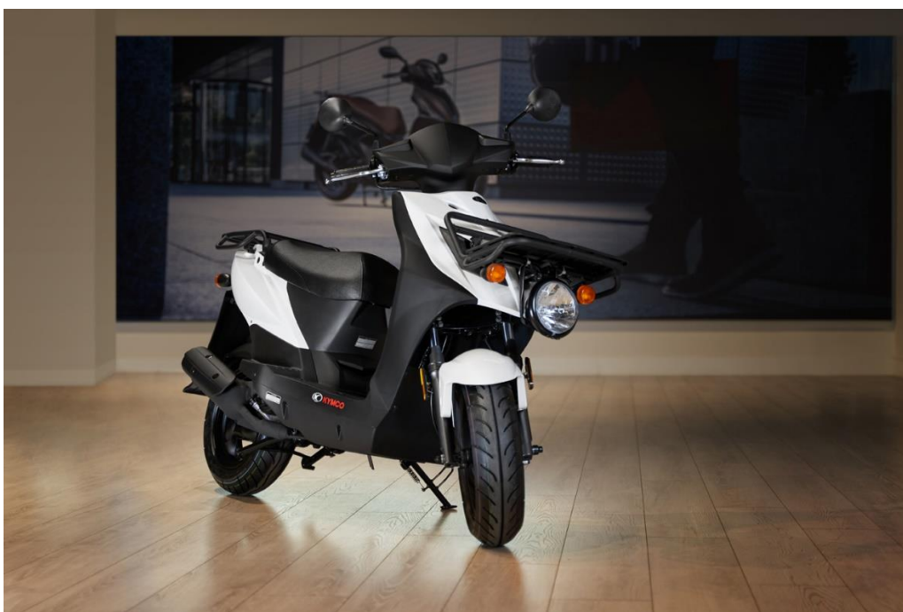
Agility Carry 50, disponible en la red KYMCO, en blanco o negro, por solo 1.999 euros (PVR). KYMCO España

Madrid, 9 de febrero. KYMCO España ha anunciado el primer vehículo profesional urbano , único en el mercado por su gran capacidad de carga gracias a sus dos portentosas parrillas: Agility Carry 50 . Este anuncio se enmarca en la apuesta de la marca por ofrecer un scooter de gran valor a los profesionales de transporte y logística que operan en entornos puramente urbanos , una profesión en auge ante el incremento del consumo online de todo tipo de productos.